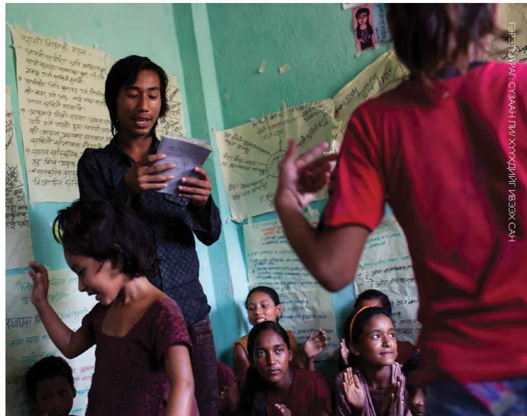
Балба улс, Сүхпет дүүргийн хүүхдийн клуб

Санамж: зохистой тохиолдолд хүүхэд, залуучуудын хэлсэн үгийг хэвээр нь оруулсан боловч үзэл бодлоо илэрхийлсэн хүүхэд, залуучуудын үгийг шаардлагатай тохиолдолд найруулгын хувьд өөрчлөх буюу нэгтгэж оруулсан болно.