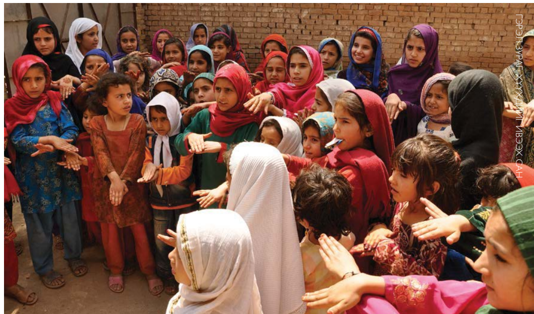
Пакистаны Пешавар дүүргийн төөрсөн хүүхдүүдэд зориулсан сургалтын түр байран дахь охид