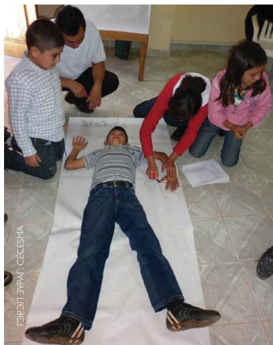
Бие зураглалын дасгал