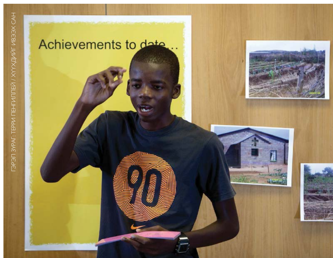
Хүүхдийг Ивээх Сангийн Дэлхийн дахины зөвлөлийн гишүүдийн семинар.