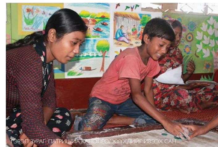
Хулна дахь хөдөлмөр эрхэлдэг хүүхдүүдийн төв, Бангладеш Улс.