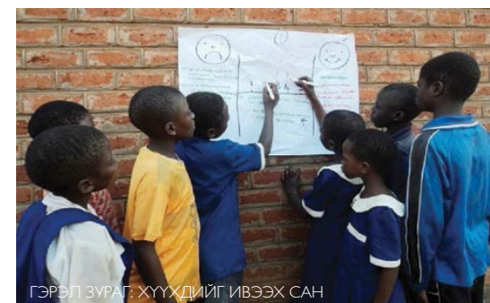
“Н” үнэлгээний ажил, Малави Улс.