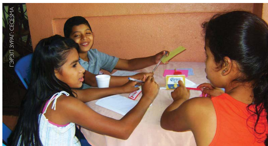
Валала дахь ХШҮ–ний төслийн суурь судалгааны хүрээнд фокус бүлэгт оролцож байгаа хүүхдүүд, Никарагуа Улс.