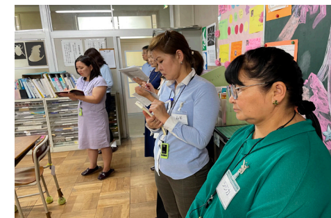
Аяллын оролцогчид Чигасаки хотын Дайчи ахлах сургуулийн тусгай хэрэгцээт боловсролын ангийн үйл ажиллагаатай танилцаж, ажилалт хийж байна. Канагава, Япон улс, 2023.09.12

Оролцогчид зочилсон байгууллага бүрээс өөрсдийн сурсан мэдсэнээ тэмдэглэж, байгууллага тус бүрийг хариуцсан нэг оролцогч тайланг нэгтгэн илтгэл болгосон. Аяллын төгсгөлд тэд сурсан зүйлсээ бусадтайгаа хуваалцан, дүгнэх уулзалт хийв.