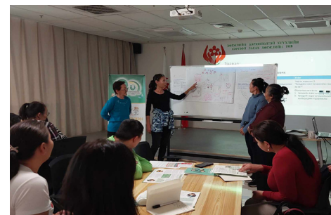
Сургалтад оролцогчид, Өвөрхангай аймгийн Арвайхээр сумын “Богд” зочид буудлын сургалтын танхим, 2023.09.25.