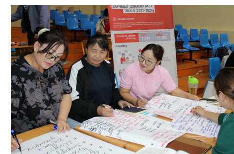
Модуль 2 сургалт, багш нар хамтран хөтөлбөрийн тохиргоо хийх дадлага ажил хийж байна. Ховд аймгийн 7-р сургууль, багш нарын өрөө, 2023.09.23.