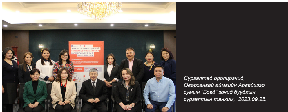
Сургалтад оролцогчид, Өвөрхангай аймгийн Арвайхээр сумын "Богд" зочид буудлын сургалтын танхим, 2023.09.25.