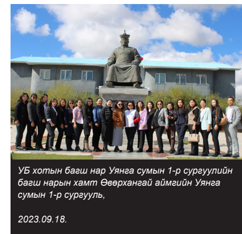
УБ хотын багш нар Уянга сумын 1-р сургуулийн багш нарын хамт Өвөрхангай аймгийн Уянга сумын 1-р сургууль, 2023.09.18.