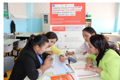
Модуль 1 сургалт, бага боловсролын багш нар шилжилтийн төлөвлөгөөг хэрхэн боловсруулах талаар ярилцаж байна. Ховд аймгийн 7-р сургууль, багш нарын өрөө, 2023.09.23.

Ховд аймгийн 7-р сургуулийн энэхүү ерөнхий сургалт амжилттай болж, цаашид ерөнхий сургалтаар олж авсан мэдлэгээ ашиглан сургууль дээрээ тэгш хамруулах боловсролын төслийг үр дүнтэй хэрэгжүүлэх болно гэж төслийн багийнхан дүгнэж байна.