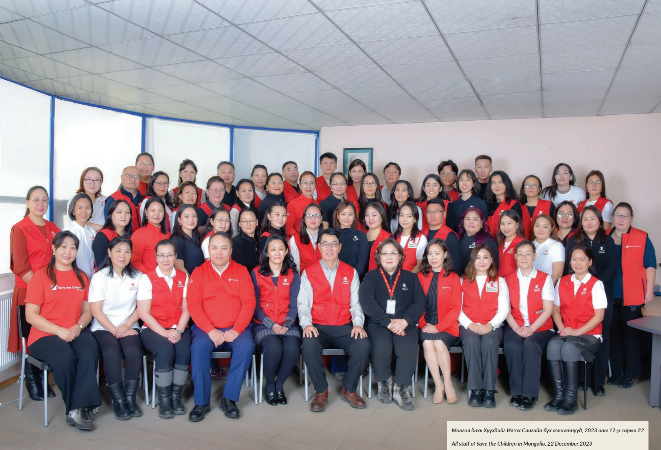
Монгол дахь Хүүхдийг Ивээх Сангийн бүх ажилтнууд, 2023 оны 12-р сарын 22 All staff of Save the Children in Mongolia, 22 December 2023