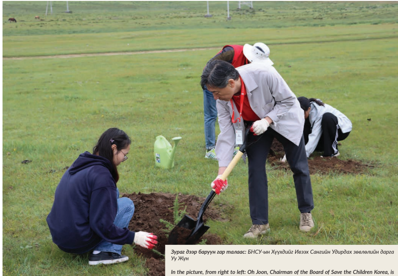
Зураг дээр баруун гар талаас: БНСУ-ын Хүүхдийг Ивээх Сангийн Удирдах зөвлөлийн дарга Уу Жүн

Энэхүү БАРИМТАГ УРАН САЙХНЫ КИНО- "Охидыг хүчирхийлэл, мөлжлөгөөс хамгаалах нь" төслийн хүрээнд бүтээв.