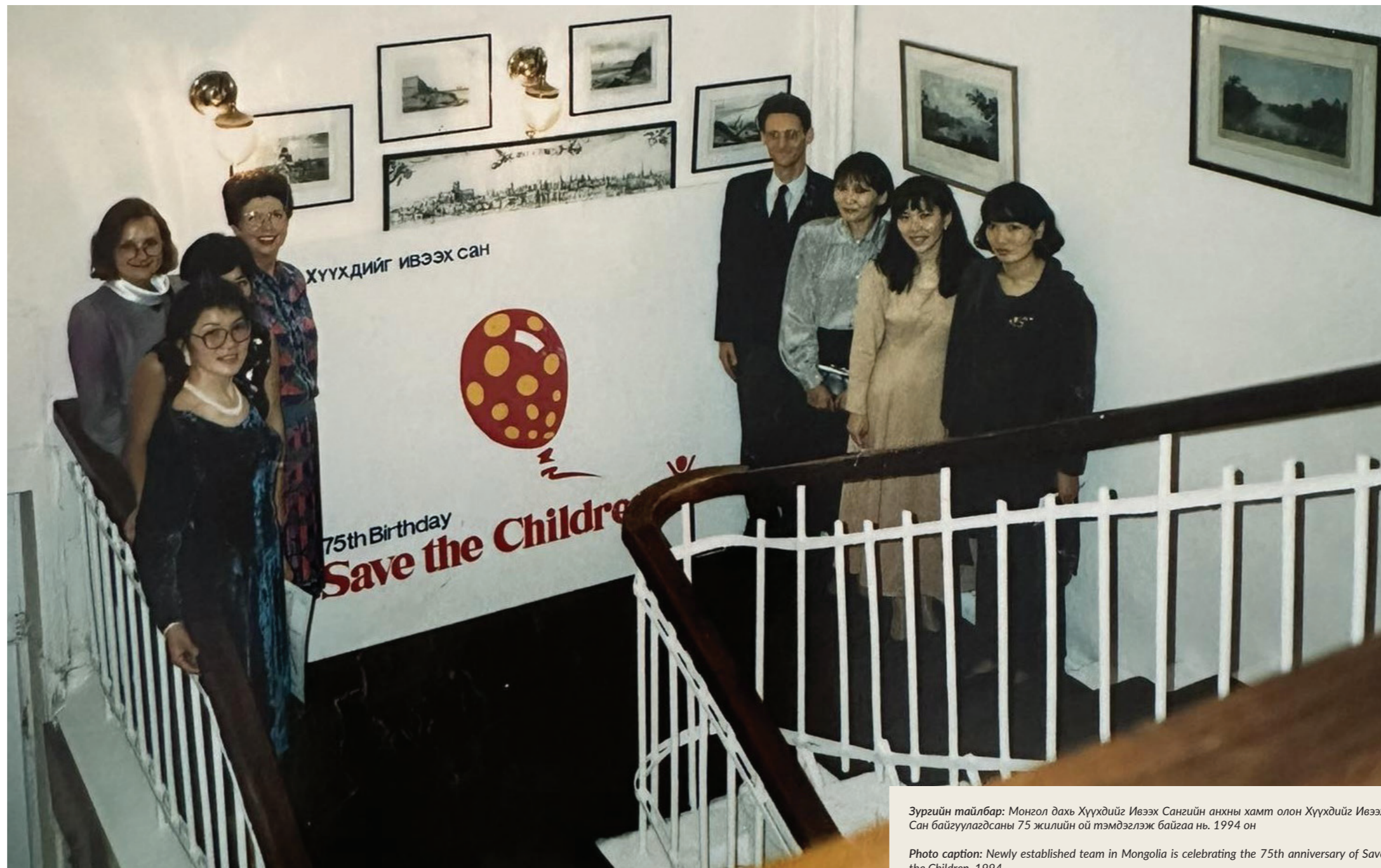
Зургийн тайлбар: Монгол дахь Хүүхдийг Ивээх Сангийн анхны хамт олон Хүүхдийг Ивээх Сан байгуулагдсаны 75 жилийн ой тэмдэглэж байгаа нь. 1994 он

Save the Children was established in Mongolia in February 1994 and began working under the management of Save the Children UK. It was a time when the economy and quality of life were declining amid social transition, and human rights conditions were deteriorating. Our work began by advocating for the creation of a child protection system and promoting a child rights-based approach. We focused on strengthening the human resources of children's organizations and enhancing the knowledge and understanding of child protection among workers in the field. At that time, Save the Children had a small team of four: Director, Translator, Assistant, and Driver.