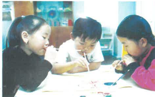
Нийслэлийн 67-р цэцэрлэг Бид зурж бүтээх шинэ арга барилд суралцаж байна.

Сургуулийн өмнөх боловсрол үндэсний хөтөлбөрийн хэрэгжилтийн жилүүдэд цэцэрлэгт хамрагдах хүүхдийн тоог 20 – 80 хувь хүртэл өсгөх, төрийн ба төрийн бус өмчийн цэцэрлэгүүдийн үйл ажиллагааг дэмжих, сургуулийн өмнөх боловсролын агуулга арга зүйг шинэчлэн боловсруулах, сургуулийн өмнөх боловсролын салбарт ажиллагсдын чадавхийг дээшлүүлэх тэднийг бэлтгэх, давтан бэлтгэх; эмзэг бүлгийн хүүхдийн боловсролыг дэмжих, малчдын хүүхдийг сургуулийн өмнөх боловсролд хамруулах, сургуулийн өмнөх насны хүүхдийн сургалтын хэрэглэгдэхүүн, тоглоом наадгайн хангамжийг сайжруулах зэрэг 8 үндсэн зорилтыг дэвшүүлжээ.