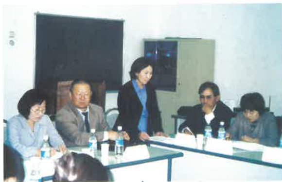
“Нийгмийн ажил” хөтөлбөрийн үнэлгээний уулзалт 2002 он УБИС

Тус хөтөлбөр нь Монголд нийгмийн ажлыг мэргэжил гэдэг утгаар анх танилцуулж, Нийгмийн ажлын боловсрол олгох тогтолцоог бүрдүүлэх, сургалтын хэрэгцээг тодорхойлох, багш нарыг бэлтгэх, сургалтын төлөвлөгөө хөтөлбөр боловсруулах, мэргэжлийн ном сурах бичгээр хангах ба эх хэл дээрх мэргэжлийн сурах бичиг бэлтгэн хэвлэх, МУБИС -ийн Нийгмийн ажлын тэнхим, Дорнод аймаг дахь Багшийн коллеж, МУИС-ийн Ховд аймаг дахь салбар их сургуулийн Нийгмийн ажлын сургалт судалгаа арга зүйн төвүүдийг байгуулж, тэнхим ба төвийн чадавхийг бэхжүүлэх, нийгмийн ажилтнуудын мэргэжлийн сүлжээг бий болгох, Монголын Нийгмийн ажилтны нийгэмлэгийг байгуулахад дэмжлэг үзүүлэх зэргээр Монголын нийгмийн ажлын үүсэл хөгжилд чухал үүрэг гүйцэтгэсэн.