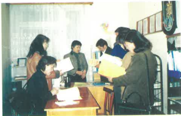
Нийгмийн ажилтнуудын туршлага солилцох уулзалт Ховд, Баянхонгор аймгийн нийгмийн ажилтнууд Дорнод аймагт

Ерөнхий боловсролын сургуульд нийгмийн ажилтныг ажиллуулах замаар нийгмийн ажлын шинэ үйлчилгээг боловсролын тогтолцоонд бий болгох энэ хөтөлбөрийн анхны санаачлага 1996 онд УБ хотын 86, 57-р сургуулиудад туршилтын маягаар эхэлсэн. Улмаар энэхүү туршилтын төслийг Монголын Хүүхдийн эрхийн төвтэй хамтран долоон аймгийн сургуулиудад амжилттай хэрэгжүүлж, үндэсний хэмжээнд сургуулийн нийгмийн ажлын үйлчилгээг бий болгох суурийг тавьсан. Боловсролын үйлчилгээг хүртээмжтэй, чанартай болгоход сургуулийн нийгмийн ажилтан чухал үүрэгтэй гэж үзэн 2002 онд шинэчлэн баталсан Боловсролын багц хуулинд ерөнхий боловсролын сургуульд сургуулийн нийгмийн ажилтан ажиллана гэж шинээр тусгасан билээ.