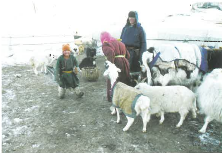
Дундговь аймаг Адаацаг сум, 2003 он

Санхүүжилт: 20,000 фунд стерлинг буюу 31 сая төгрөг