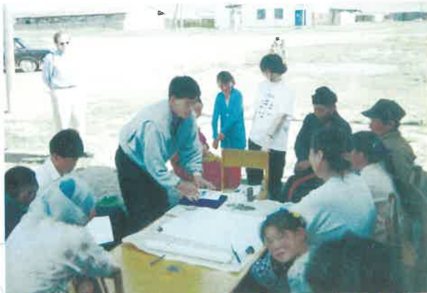
ЯБҮХГ, Нийгмийн Хөгжлийн Төвтэй хамтран "Малжуулах" төслийн хэрэгцээг судлах ажиллагаа 1997 он, Архангай аймаг

Хөтөлбөрийн зорилго: Нийгмийн хөгжлийн тухай орчин үеийн түлхүүр ойлголт, орон нутгийн иргэдийн оролцоо нь нийгмийн хөгжилд ямар үүрэгтэй байх талаар олон нийтийн дунд мэдлэг бий болгох, нийгмийн хөгжил дэх оролцооны зарчмыг Монголын Засгийн газраас 1994-2000 онуудад хэрэгжүүлсэн Ядуурлыг Бууруулах Үндэсний Хөтөлбөрийн үйл ажиллагааны үндсэн зарчмын нэг болгон төлөвшүүлэх замаар ЯБҮХГ болон түүний орон нутаг дах салбар зөвлөлүүдийн чадавхийг бэхжүүлэх, оролцооны зарчимд суурилсан мониторинг үнэлгээний системийг нэвтрүүлэх.