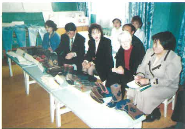
Төслийн тайлангийн ажиллагаа, Сонгино-Хайрхан дүүрэг

Орлого нэмэгдүүлэх төсөлд хамрагдсан эхчүүдийн ажиллах боломжийг хангах зорилгоор нийт 313 хүүхдийг шинээр сургуулийн өмнөх боловсролд хамруулан тэдний цэцэрлэгийн хоолны мөнгөний эцэг эхээс төлөх хувийг 6 сарын хугацаатай төслийн санхүүжилтээр төлөн нэг удаа хувцас, хичээлийн хэрэгслээр хангасан билээ. Төслийн хугацаанд хүүхдүүдийг хүлээн авч ажилласан 6 сумын цэцэрлэг тус бүрийн 2-3 бүлгийг тоглоомоор хангасан.