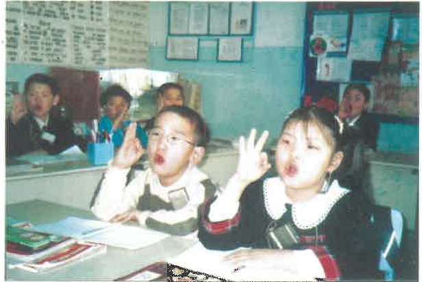
Хөгжлийн бэрхшээлтэй хүүхдүүд боловсрол эзэмших эрхтэй.