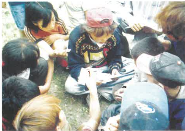
Үе тэнгийн сургагч нар

ХИС-аас ДОХ, БЗХӨ-ий талаар хүүхдэд зориулан хялбаршуулсан сургалтын хөтөлбөр, гарын авлагыг тэдний оролцоо, санал бодлыг үндэслэн гаргасан. Сургалтыг явуулах сургагч багш болон үе тэнгийн сургагч нарыг бэлтгэж эхэлсэн.