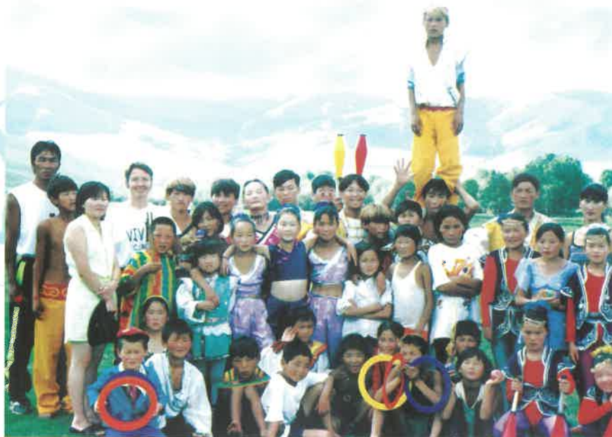
Цирк төслийн хүүхдүүд: "Цирк", "Зуны зуслан" төслүүд нь Канад сангийн санхүүжилтээр хэрэгждэг.

Халамжийн, өдрийн болон олон нийтэд түшиглэсэн төвүүдийн үйлчилгээний чанар, хүртээмжийг сайжруулах, хүүхдэд ээлтэй халамж хамгааллын загварыг бий болгох зорилгоор төвүүдэд түшиглэсэн нийгмийн ажлын төрөл бүрийн үйлчилгээг бий болох, хүүхдийн хөгжил, оролцоо ба нийгэмших үйл явцыг дэмжсэн албан ба албан бус сургалтыг зохион байгуулах ба