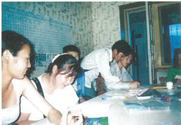
Хүүхдийн эсрэг хүчирхийллийн чиглэлээр хүүхдийн клубын удирдагч нарын бэлтгэх сургалт ХЭҮТ 2002 он

Энэ хөтөлбөрийн хүрээнд Хүчирхийллийн эсрэг үндэсний төвийн Хүүхэд хамгааллын нэгж (ХХН) байгуулах, тус нэгжийн чадавхийг бэхжүүлэх, хүүхдийн эсрэг хүчирхийллийн чиглэлээр