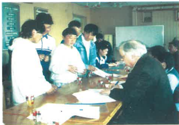
Хөдөлмөр эрхэлдэг хүүхдүүдийг Барилгын коллежид суралцуулах гэрээг тус сургууль дээр хийж байгаа нь

Хөтөлбөрийн зорилго: Уг хөтөлбөр нь 1996 оноос эхэлсэн бөгөөд тухайн үед улам бүр өсөн нэмэгдэж байсан хөдөлмөр эрхэлж буй хүүхдүүдийн өмнө тулгарч байгаа асуудлуудыг шийдвэрлэх, хүүхдийн хөдөлмөр эрхэлж буй нөхцөл, шалтгааны талаарх олон нийтийн