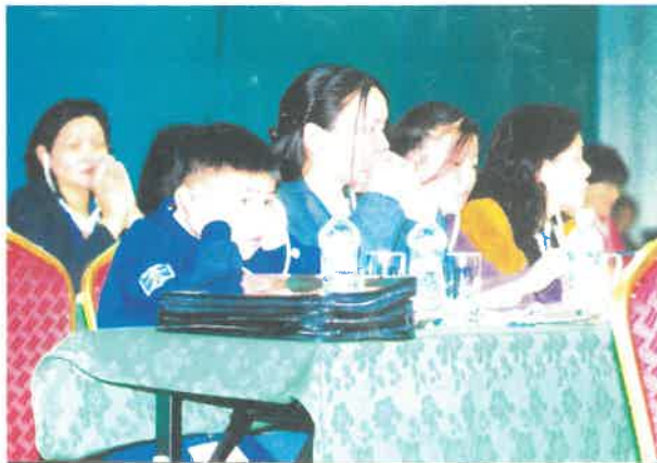
“Хараа хяналтгүй хүүхдүүдэд чиглэсэн бодлого, практик үйл ажиллагааг боловсронгуй болгох нь” үндэсний семинарын үеэр

Хүүхдийн төлөө үндэсний газар (хуучин нэрээр Хүүхдийн төлөө Үндэсний төв), Монголын Хүүхдийн эрхийн төв, Нийслэлийн Хүүхэд залуучуудын хөгжлийн газар, Дорнод, Сэлэнгэ, Төв, Дархан-Уул аймгийн Засаг даргын тамгын газар, Аймгийн Хүүхдийн төлөө төвүүд, Цагдаагийн Ерөнхий Газар болон Нийслэлийн цагдаагийн газар, Дорнод, Сэлэнгэ, Дархан-Уул аймгууд дахь Засаг даргын дэргэдэх Цагдаагийн хэлтсүүд, МУБИС-ийн Нийгмийн ажлын тэнхим