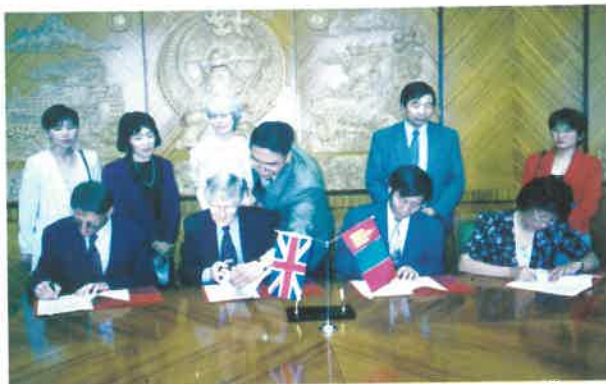
1997 оны 12-р сар Төслийг хэрэгжүүлэх гэрээнд талууд гарын үсэг зурж байгаа нь

Хөтөлбөрийн нэр: 3. ЯБУХ-ийн хүрээнд хэрэгжсэн Сургуулийн өмнөх боловсролыг дэмжих хөтөлбөр