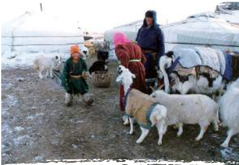
Зудын үеийн малчин өрх, Дундговь аймаг, 2003 он

2001 онд Дорнод аймагт гар, хөл, амны өвчин гарч хорио цээр тогтоосон үед ХИС-гаас 10,3 сая төгрөгийн тусламж дэмжлэгийг орон нутгийн байгууллагуудад үзүүлсэн юм. Нийт 310 ядуу өрх болон сургуулийн дотуур байрыг хүнс,