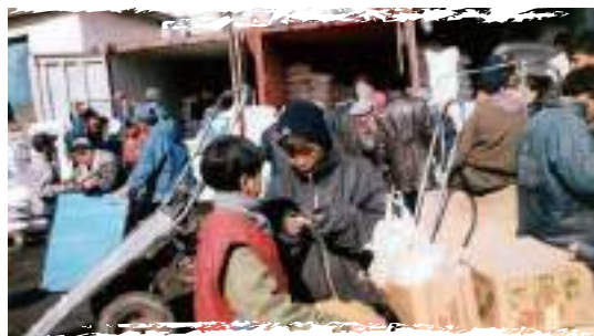
Зах дээр хөдөлмөр эрхлэгч хүүхдүүд Улаанбаатар, 1996 он

хөгжүүлэх явдал байсан боловч ойрын хугацааны, урьдчилан сэргийлэх, нөхөн сэргээх үйл ажиллагаа яаралтай шаардагдаж байлаа. Ийм нөхцөлд, 1996 оны 12-р сард Монгол Улсын Шадар сайд олон улсын байгууллагуудад хандан гудамжны хүүхдийн асуудлыг шийдвэрлэхэд туслахыг хүсч уриалга гаргасны хариуд ХИС хараа хяналтгүй хүүхдүүдэд зориулсан төвүүдийг анх байгуулсан билээ. ХИС нь асуудлын хоёр тал буюу урьдчилан сэргийлэх ба нөхөн сэргээх үйл ажиллагааны аль алинд нь анхаарлаа хандуулан ажилласан юм. Гэр бүлээ тэжээхийн тулд олон хүүхэд сургуулиа орхин, янз бүрийн эдийн засгийн үйл ажиллагаанд, заримдаа хүнд, хортой хөдөлмөрт татагдан орж байсан тэр үед буюу 1996 оноос ХИС “Хөдөлмөр эрхлэгч хүүхэд” хөтөлбөр хэрэгжүүлсэн эхэлсэн юм. Хүүхдүүд, ялангуяа хөвгүүд зах дээр хүнд ачаа зөөх, гутал цэвэрлэх, машин угаах, гудамжинд жижиг худалдаа хийх зэргээр мөнгө олохын тулд олон цагаар ажиллаж байв. Энэ чиглэлээр ХИС-гийн хэрэгжүүлсэн олон тооны жижиг төслүүд нь хөдөлмөр эрхэлж байгаа хүүхдүүдийг хүнд, хортой ажлаас хөндийрүүлэх, хөдөлмөрийн багаж зэвсэг олгож тэдний хөдөлмөрийг хөнгөвчлөх, сурах болон хөгжих боломжийг нь нэмэгдүүлэх, хүүхдүүдэд ажил, сургуулиа хослуулах боломжийг олгоход чиглэгдэж байсан юм. Насанд хүрэгчид болон “үе тэнгийн сургагч” нараар дамжуулан хэрэгжүүлсэн ХИС-гийн амьдрах ухааны сургалтууд нь өндөр эрсдэлтэй орчинд ажиллаж, амьдарч байгаа