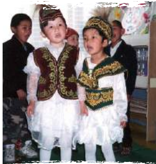
Казах хүүхдүүд цэцэрлэг дээрээ, Баян-өлгий аймаг

Хороонд гаргасан Монгол Улсын Засгийн газрын тайланг дагалдах сүүдэр тайлангийн үүрэг гүйцэтгэсэн юм. Үүний үр дүнд тус хорооноос 2006 онд Засгийн газарт өгсөн дүгнэлт зөвлөмжинд “...Үндэсний цөөнхийн хүүхдүүдэд өөрсдийн эх хэлээр сурах боломжоос гадна улсын албан ёсны хэлийг сурах боломжийг бүрдүүлж, хос хэлээр сурах тогтолцоог бий болгон хөгжүүлэхийг” онцлон зөвлөсөн билээ. ХИС-гийн арга зүйн дэмжлэгтэйгээр боловсруулсан “Казах хүүхдийн боловсролыг дэмжих хөтөлбөр”-ийг (2008–2012) БСШУЯ-наас батлан хэрэгжүүлж эхлээд байна. Уг хөтөлбөрийн хүрээнд казах хэлээр сургалт явуулдаг сургуулийн сургалтын төлөвлөгөө, агуулга, хөтөлбөрийг шинжлэх ухааны үндэстэй судлан тогтоох, казах хүүхдийн онцлог хэрэгцээнд нийцсэн хос хэлээр сурах, сургах арга зүйг хөгжүүлэх, сурах бичиг, сургалтын тоног төхөөрөмж, хэрэглэгдэхүүнийг казах хүүхдийн эрэлт хэрэгцээнд тохиромжтой, хүртээмжтэй болгох, казах хүүхдүүдэд тэгш, тохиромжтой байдлаар боловсролын үйлчилгээг хүргэх менежментийг боловсронгуй болгох зорилтуудыг дэвшүүлэн тавьсан юм.