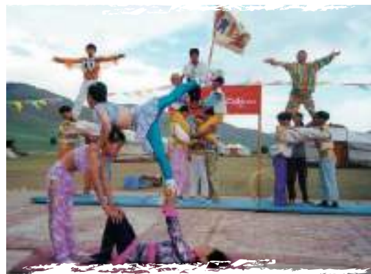
2000 оноос эхлэн амжилттай хэрэгжиж байгаа “Нийгэмшүүлэх цирк” төсөл олон хүүхдэд авьяасаа нээж хөгжихөд нь тусалсан билээ. Хүүхдүүд циркийн үзүүлбэр бэлтгэж байна. Гачуурт, 2000 он