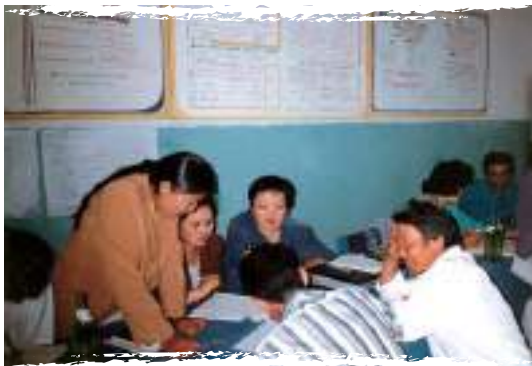
“Хүүхэд төвтэй хөгжил” орон нутгийн сургалт. Ховд аймаг, 1995 он

Шилжилтийн тэр үед шинээр гарч ирж байсан нийгмийн олон асуудалтай тулж ажиллахад Монголын хүүхдийн ажилтнуудад шинэ арга барил, ур чадвар ихээхэн дутагдаж байв. Иймээс ХИС–гаас “Хүүхэд төвтэй хөгжил”